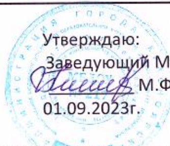
График выдачи питания в МБДОУ № 217 корпус А

ОКПО 53640952 ОГРН 1032402644449 ИНН/КПП 2465047118/246501001