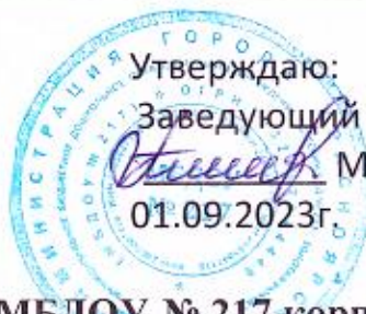
График выдачи питания в МБДОУ № 217 корпус Б

ОКПО 53640952 ОГРН 1032402644449 ИНН/КПП 2465047118/246501001