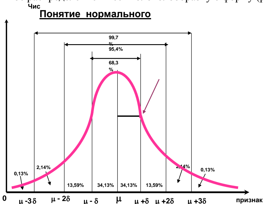
Рис. Кривая нормального распределения К.Гаусса

Нормальное распределение имеет колоколообразную форму (рис. 1).